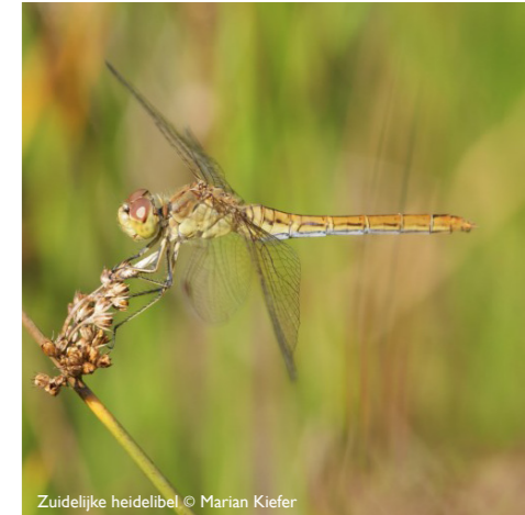
Zuidelijke heidelibel