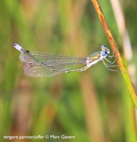
tengere pantserjuffer

waarneming van een soort op een bepaalde dag op een bepaalde plaats door een waarnemer