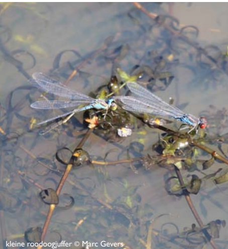
kleine roodoogjuffer