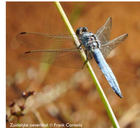
Zuidelijke oeverlibel