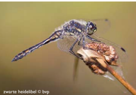
zwarte heidelibel